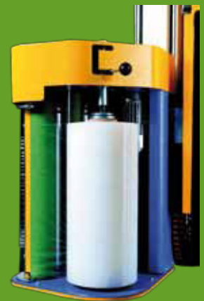
2-motoriges Vorrecksystem C7