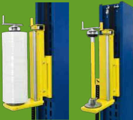
Kernbremse - C0