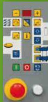
2 Programme OP2