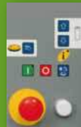
1 Programm OP1